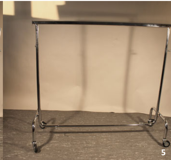
Stecken Sie die zweite Stange in das restliche Seitenteil